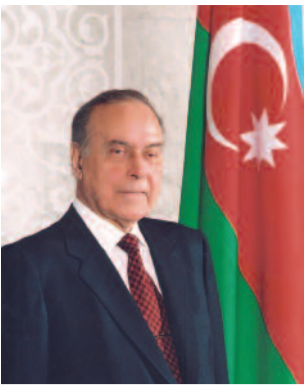
Doğma, canım-varlığım qədər sevdiyim Azərbaycanım mənim qibləgahımdır